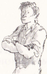
Tatăl lui Danny